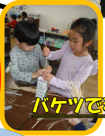
バケツで稲作もいよいよ終章