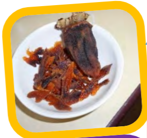
干し柿、幼児さんは食べることが出来ました！好評でしたよ！

今年も“小山さん家の芋煮会”をすることができました。園で採れた里芋を使い、稲作は少しだけとれたお米を加え飯盒に！特別な昼食になったと思います。