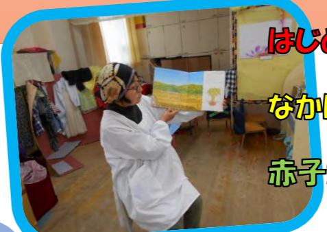
はじめちょろちょろ