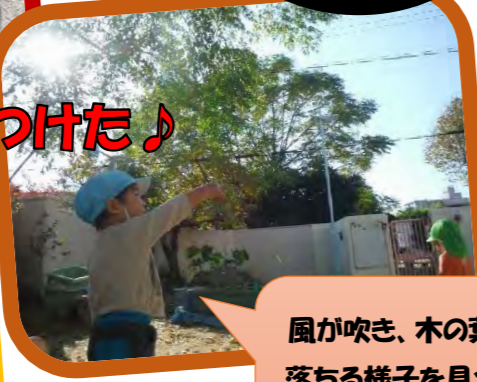
風が吹き、木の葉がたくさんひらひら落ちる様子を見つけて「あ！いっぱい」と指をさしていました